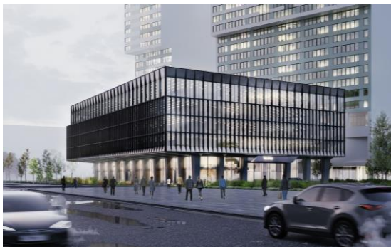
Business Club на Ходынском поле 10 тыс. кв. м офисов / 1 426 рабочих мест

+38 тыс. кв. м офисов / +5 тыс. раб. мест