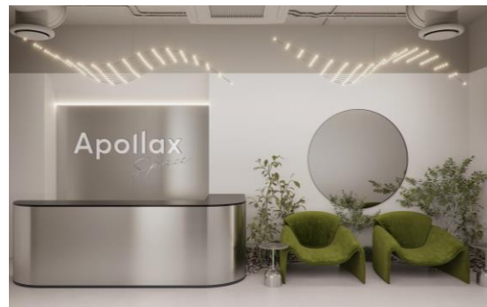
Apollox Space Технопарк 3 тыс. кв. м офисов / 418 рабочих мест