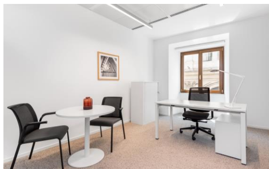
Signature Столешников 5 тыс. кв. м офисов / 479 рабочих мест