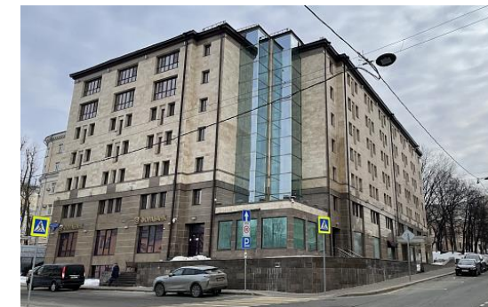
Атмосфера Подколокольный 3 тыс. кв. м офисов / 315 рабочих мест