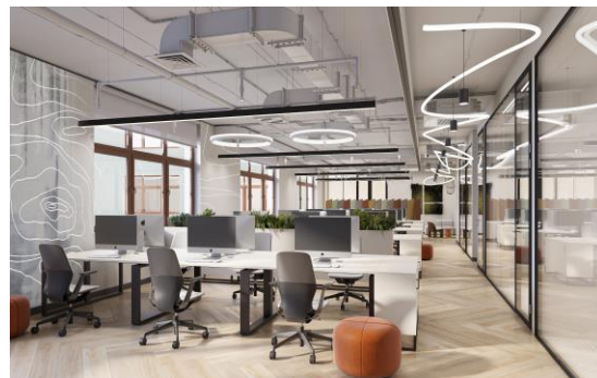
Apollox Space Никольская 7 тыс. кв. м офисов / 952 рабочих места