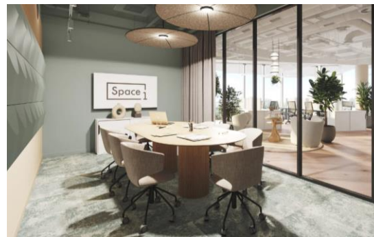
Space 1 Лужники 2 тыс. кв. м офисов / 325 рабочих мест