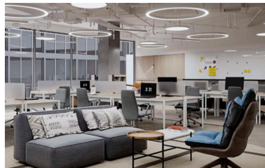
CityStone 5 тыс. кв. м офисов / 650 рабочих мест