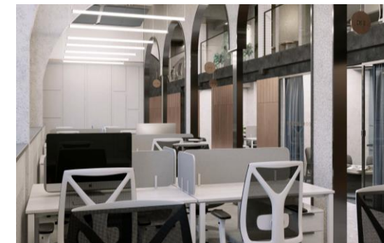
Малый Каретный пер., 11, с. 3 3 тыс. кв. м офисов / 488 рабочих мест