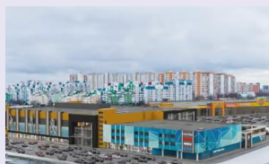
ТРЦ Митино парк GLA: 27 тыс. кв. м