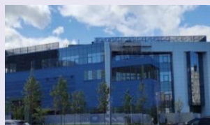
ТЦ «Кувшинка» GLA: 5,3 тыс. кв. м

За первое полугодие 2023 года 3 торговых центра в Москве были введены в эксплуатацию и открыты для посетителей – Митино Парк (GLA: 27 тыс. кв. м), ТЦ «Сиеста» (GLA: 14 тыс. кв. м) и ТЦ «Кувшинка» в составе ТПУ «Озерная» (GLA: 5,3 тыс. кв. м).