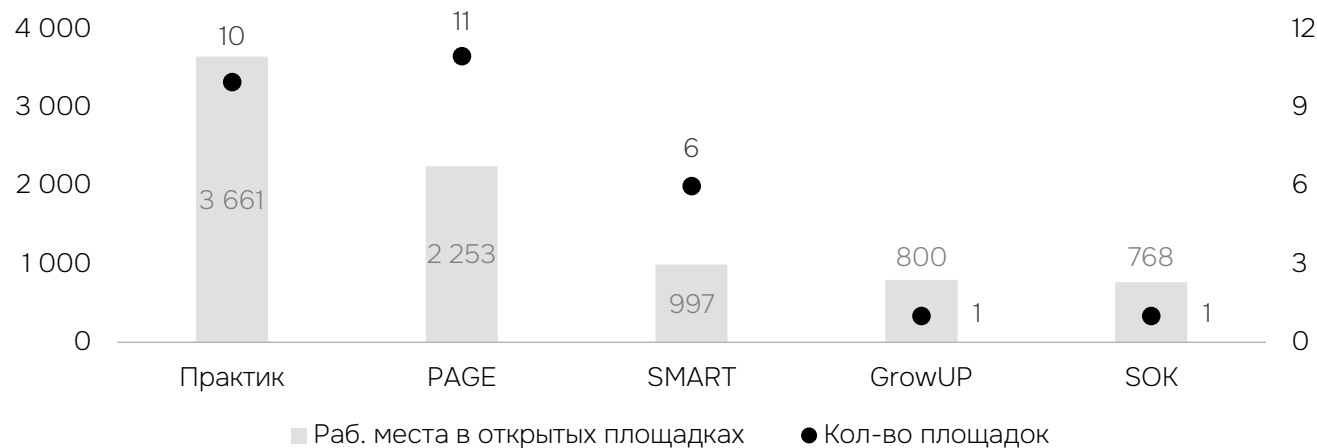
Крупнейшие сетевые операторы по количеству рабочих мест в сервисных офисах

Ключевые субрынки по расположению сетевых сервисных офисов – Центр (28,4 тыс. кв. м, 5,0 тыс. раб. мест), Набережные (10,8 тыс. кв. м, 2,2 тыс. раб. мест) и Васильевский остров (9,6 тыс. кв. м, 1,6 тыс. раб. мест). В этих локациях суммарно открыты около 70% всех площадей.